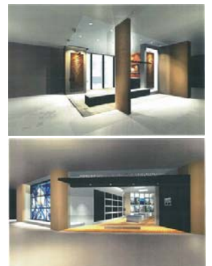
<スタジオパース図>